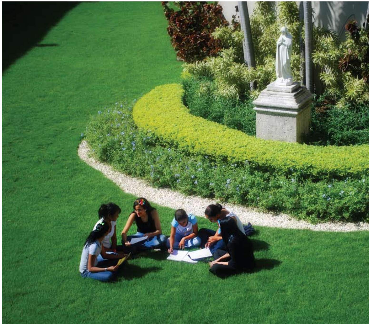
Los estudiantes han asumido un pensamiento crítico y científico con relación a la problemática medioambiental que actualmente enfrenta la humanidad.

Tallaj refiere que en esta asignatura, aparte de los trabajos que los estudiantes realizan, participan de las jornadas de concientización ecológica y asisten a una excursión que hace las veces de “laboratorio vivo”. Esta actividad se lleva a cabo en la Mina de Cerro Maimón en la Presa de Hatillo en el proyecto agroecológico “El Sabrito” con el interés de