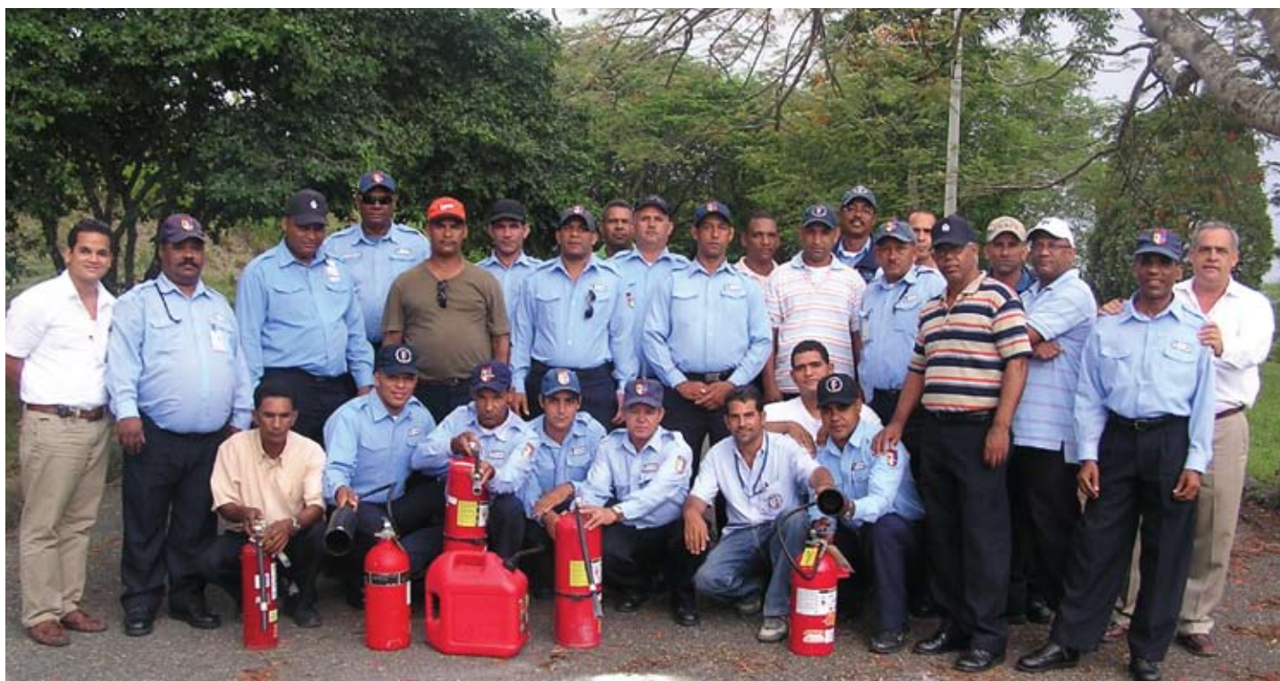
La Unidad SSA ha formado y capacitado brigadas de emergencias, compuestas por personal de la PUCMM.