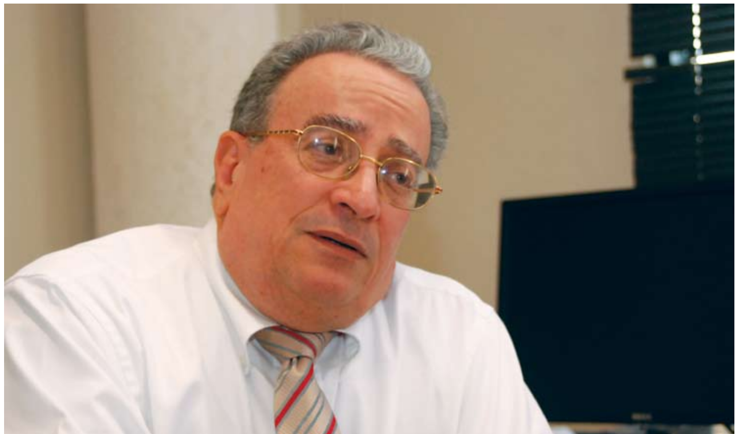
“Una universidad que se respete, es una universidad que debe de investigar”.

Las investigaciones también han demostrado que el ejercicio del docente debe ser autónomo y profesoral. Cada acto que el maestro realice es un acto que tiene que ser un ejercicio profesional, a la luz de sus conocimientos y experiencias; él tiene que tomar decisiones. Lo que tiene que hacer con el niño A tiene que ser diferente de lo que hace con el niño B y eso lo hace porque es una decisión que debe tomarla en el momento preciso de actuar. Si es