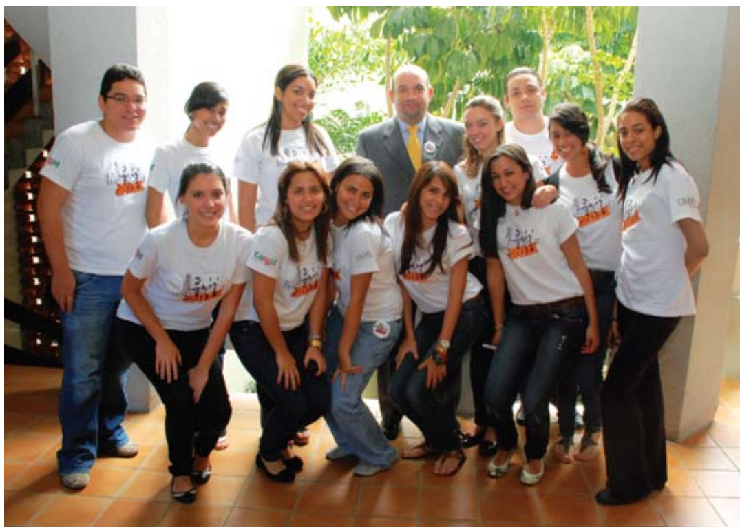
Expomarketing 2011 fue organizado por la escuela de Mercadeo y el Comité de Estudiantes (CEMER).

El que estudia Mercadeo en la Madre y Maestra ingresa al campo laboral como un gestor en Marketing”.