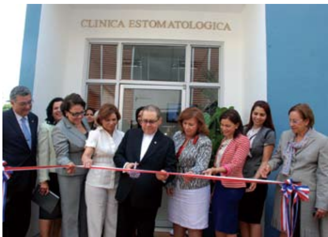
Monseñor Agripino Núñez Collado realiza el corte de cinta para dejar inaugurada la Clínica.

La clínica del CSTA cuenta además con un área radiológica digital, única en el país, la cual reducirá en un 80 por ciento las radiaciones, además de eliminar 100 por ciento el uso de films tradicionales, lo que ofrecerá mejor calidad y resolución de las imágenes odontológicas.