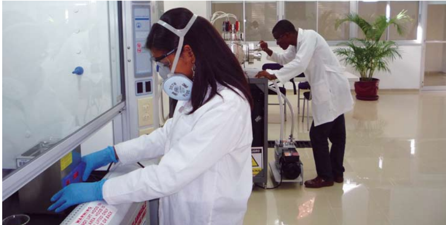
Estudiantes investigando en el nuevo laboratorio de investigación en Nanociencias de la PUCMM-STI, el primero de este tipo en el país.

NANOCARBON , bajo la dirección del doctor Fabrice Piazza, desarrolla un programa de investigación enfocado en la síntesis de materiales funcionales nanoestructurados de carbono (NCMs), cuyo uso apunta hacia nuevas aplicaciones en mercados emergentes.